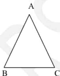
आकृति (i) में In figure (i)

प्रश्न-2 नीचे दी गई आकृतियों में सभी कोणों को पहचान कर उन्हें न्यून कोण अथवा समकोण के रूप में लिखिए 3+3=6 In the given figures, identify all the angles, and write them in the form of acute angle or right angle -